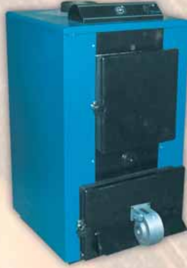
LİNYİTOMAT - FANLI